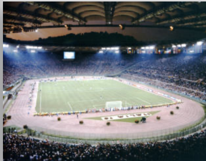
Stadio Olimpico ROMA