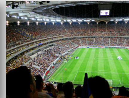
Lia Manoliu National Stadium BUCAREST

*(Global Sustainability Assessment System)