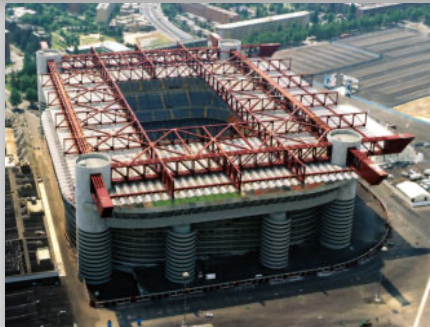
Stadio San Siro MILANO